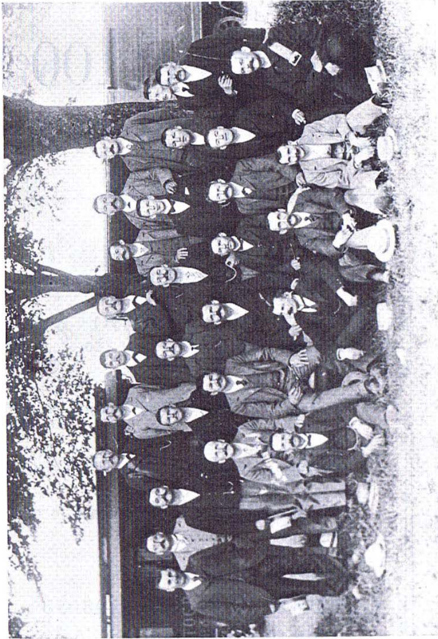
La Chorale de L'Orient en 1905