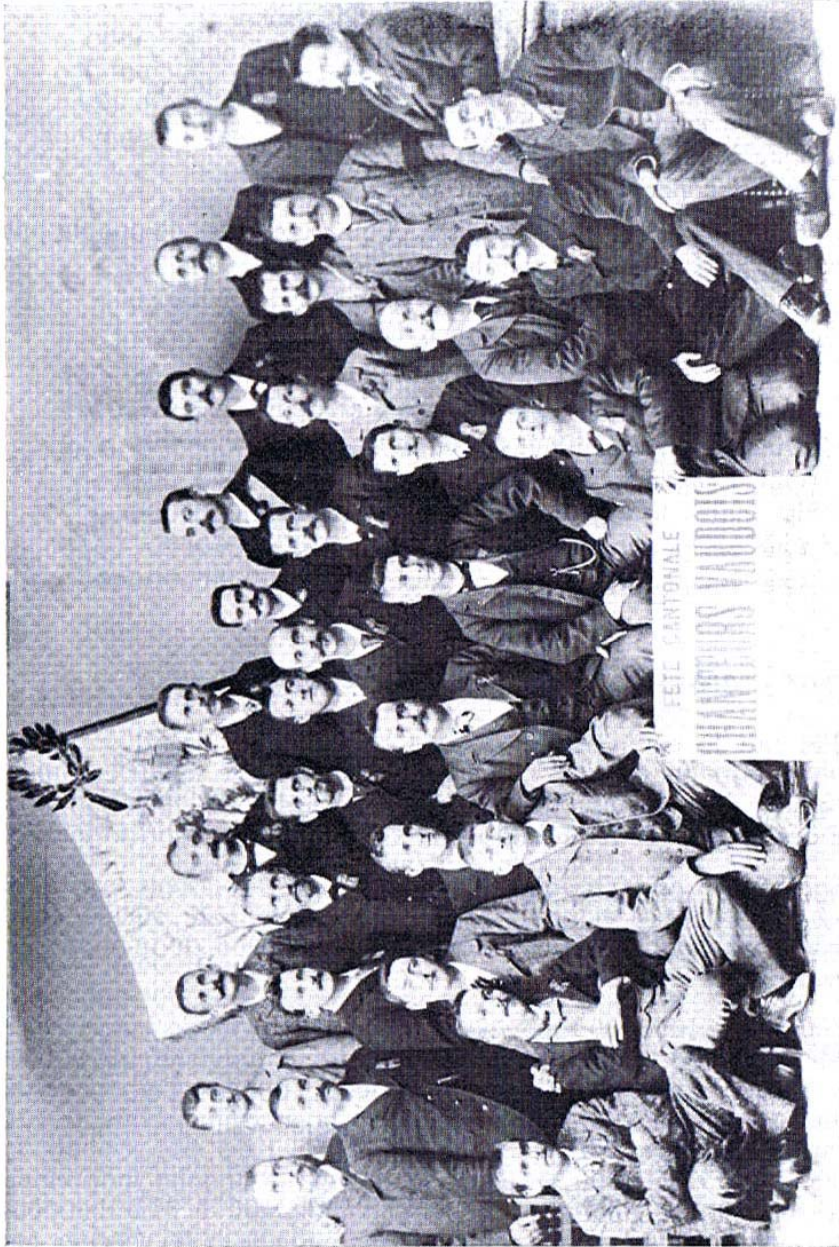
Nyon 1898 : 1er concours de la Chorale de L'Orient, de la SCCV