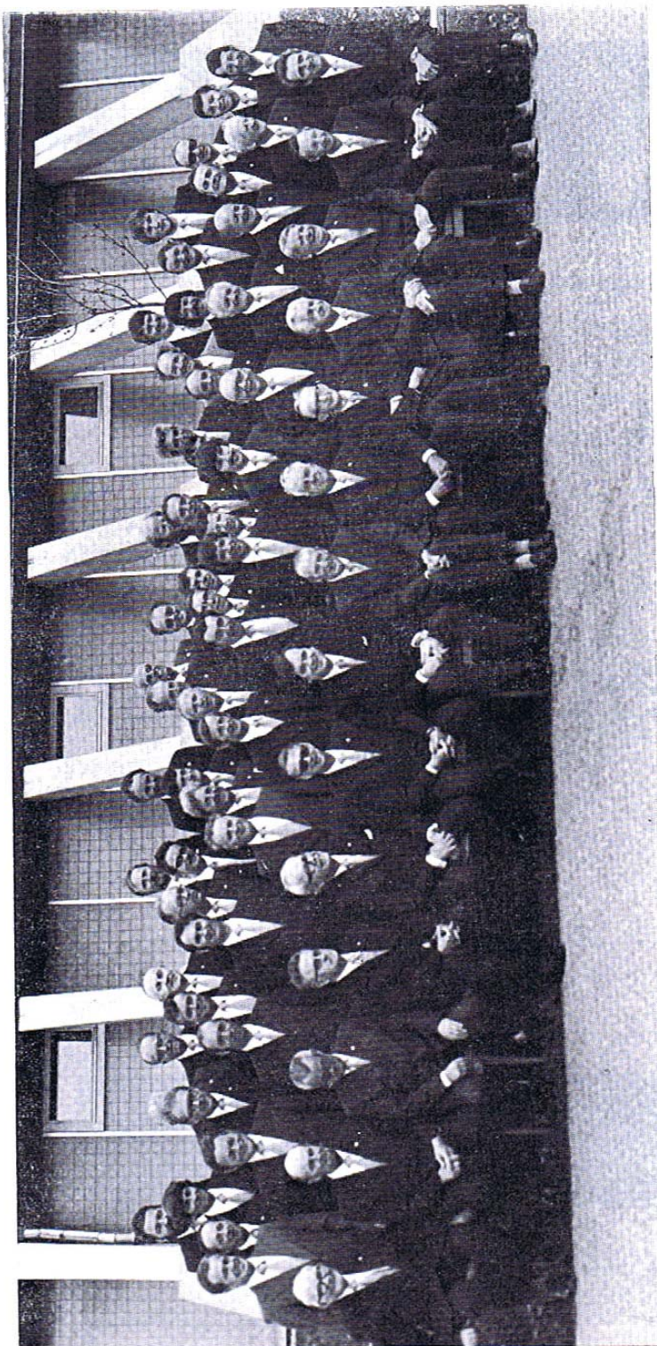
La Chorale de L'Orient en 1980